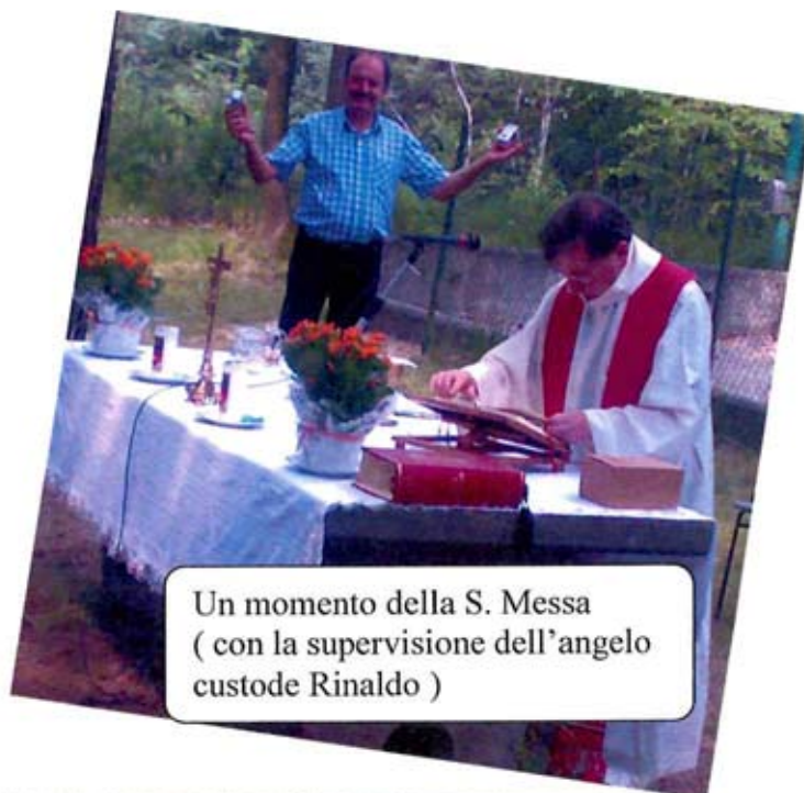
Un momento della S. Messa ( con la supervisione dell'angelo custode Rinaldo )