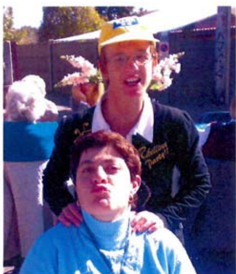
Le due veline: la rossa e la mora.