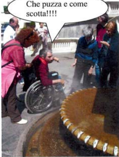
Che puzza e come scotta!!!!