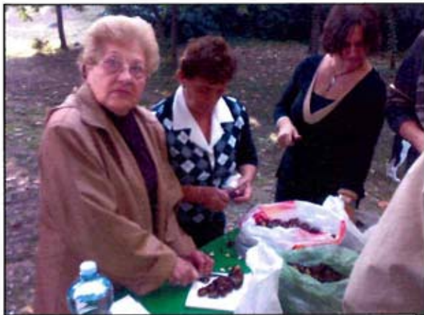
Le intagliatrici al lavoro.

E' stata veramente una bella giornata, in cui la protagonista è stata l'amicizia e la voglia di stare insieme, in armonia.