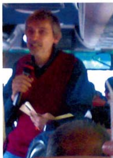
L'animatore dei giochi