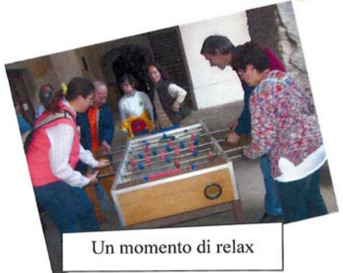
Un momento di relax