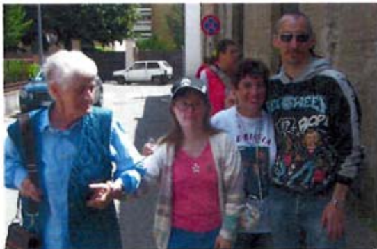
A spasso per le vie del paese.