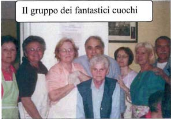
Il gruppo dei fantastici cuochi